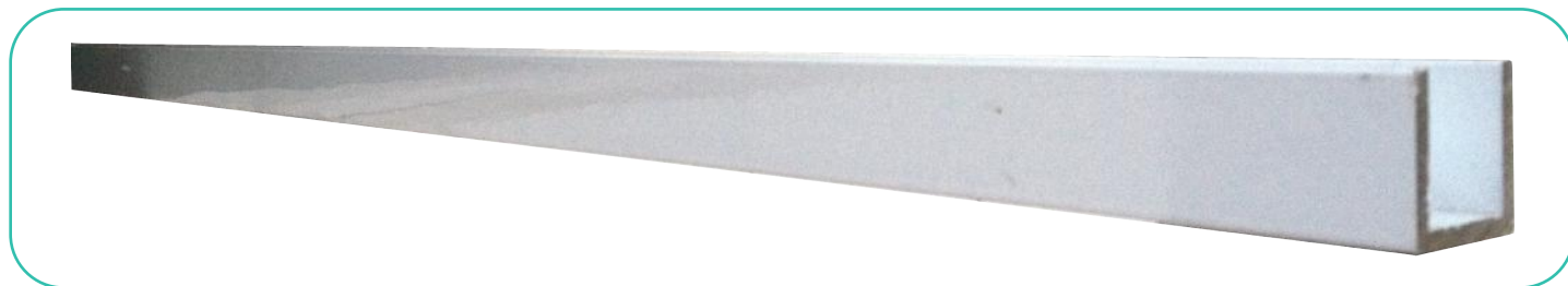
- perfil de alumínio.