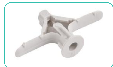
- bucha para drywall